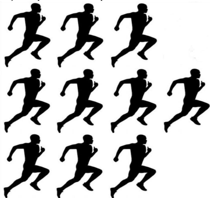
Imagem 1 – Formação dos pelotões civis - 10 pessoas

Artigo 48º. Os pelotões civis deverão correr em formação de três colunas, lado a lado, com o capitão à frente (vide imagem 1), em todo o percurso. As únicas exceções previstas ocorrerão no momento da passagem pelos pontos de hidratação, onde haverá natural dispersão para o recebimento de água e na eventualidade de atendimento médico aos atletas.