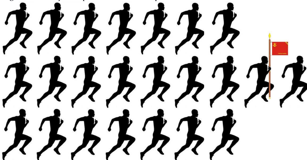
Imagem 2 – Formação dos pelotões militares – 23 pessoas

Artigo 73º. Os pelotões militares deverão correr em formação de três colunas lado a lado, com o Capitão à frente seguido imediatamente pelo Porta-Guião (vide imagem 2), em todo o percurso. As únicas exceções previstas ocorrerão no momento da passagem pelos pontos de hidratação, onde haverá natural dispersão para o recebimento de água e na eventualidade de atendimento médico aos atletas.