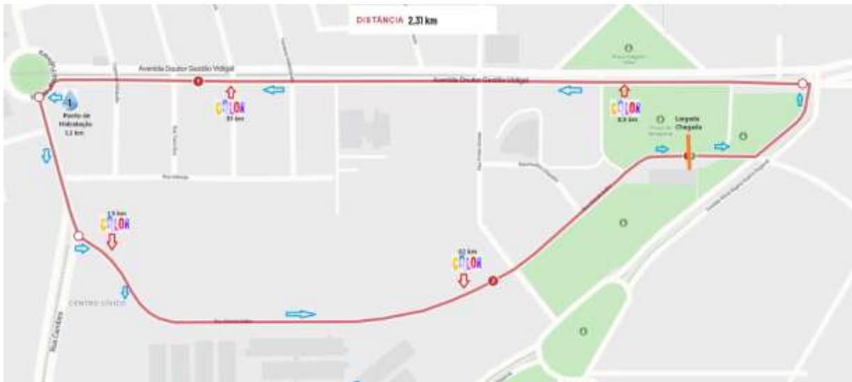
Figura 2 - Percurso modalidade Festiva 2,3 km