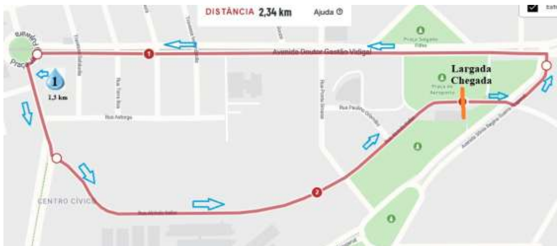
Figura 3 Percurso da caminhada de 2,3 km

DESCRIÇÃO : Largada na Rua Alcindo Keller (Praça do Antigo Aeroporto), vire à esquerda na Avenida Sônia Regina Guerra Nogaroli e vire à esquerda na pista contramão da Avenida Doutor Gastão Vidigal, vire à esquerda na Rua Cambira, Ponto de Hidratação (1,3 km), vire na Rua Alcindo Keller.