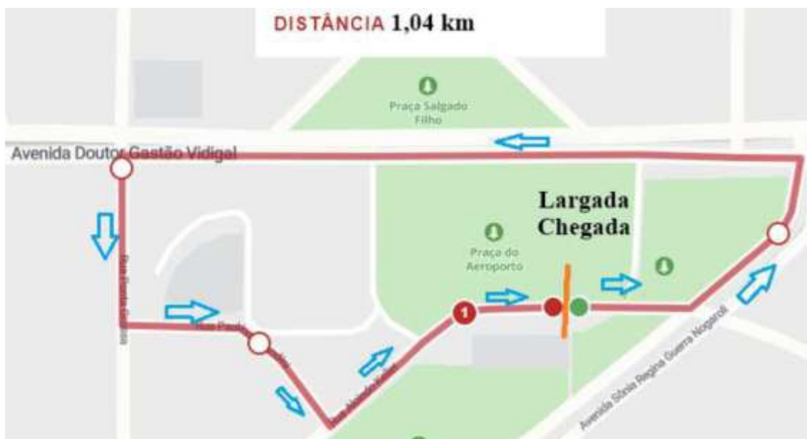
Figura 7 Percurso das categorias sub-14 e sub-16 (1.000m)

DESCRIÇÃO: LARGADA Rua Alcindo Keller (Praça do Aeroporto), vira à esquerda na Avenida Sônia Regina Guerra Nogaroli , vira à esquerda na Avenida Doutor Gastão Vidigal , vira à esquerda na Rua Ponta Grossa , vira à esquerda na Rua Paulino Orlandini, vira à esquerda na Rua Alcindo Keller (Praça do Aeroporto). CHEGADA .