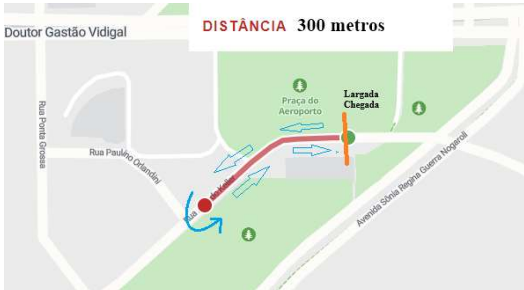
Figura 5 Percurso da categoria sub-08 (300m)

DESCRIÇÃO: Largada e chegada no mesmo local, em sentidos opostos: o atleta percorre 150 metros a partir do pódio, realiza o retorno e percorre 150 metros de volta para cruzar a linha de chegada.