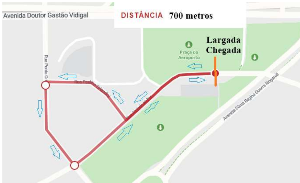
Figura 6 Percurso da categoria sub-11 (700m)

DESCRIÇÃO: LARGADA Rua Alcindo Keller (sentido Praça do Aeroporto), vire à direita na Rua Paulino Orlandini, vire à esquerda na Rua Ponta Grossa, vire novamente à esquerda para retornar à Rua Alcindo Keller e siga direto até a linha de CHEGADA .