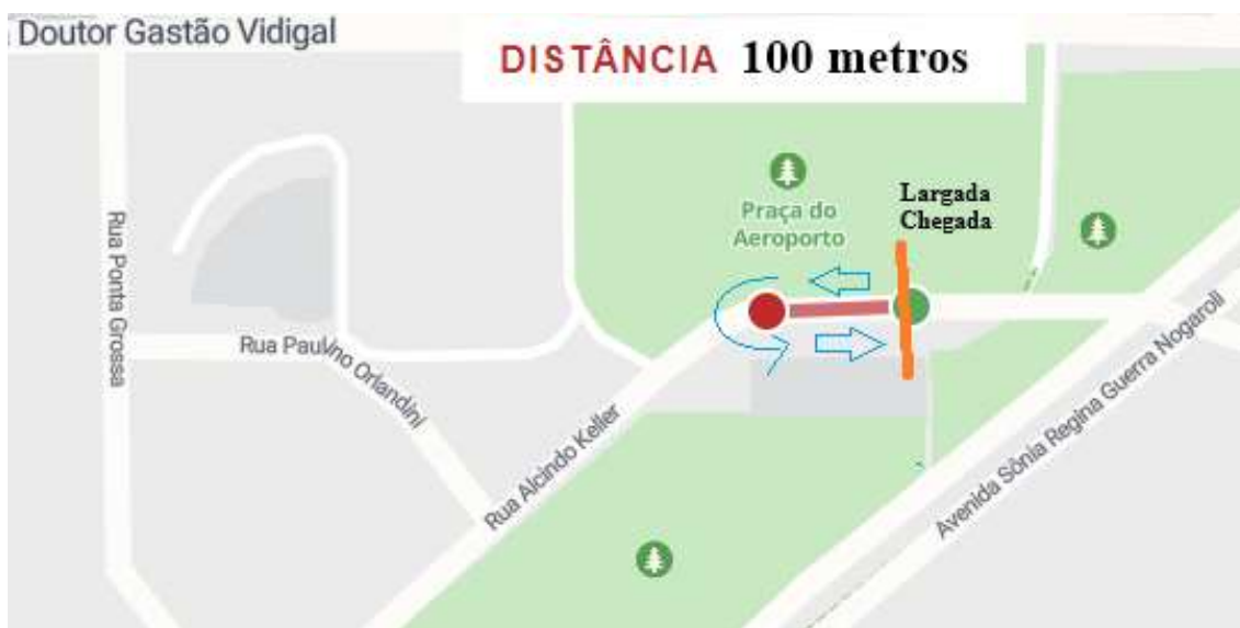
Figura 4 Percurso da categoria sub-05 (100m)

DESCRIÇÃO: Largada e chegada no mesmo local , em sentidos opostos: o atleta percorre 50 metros a partir do pódio, realiza o retorno e percorre 50 metros de volta para cruzar a linha de chegada.