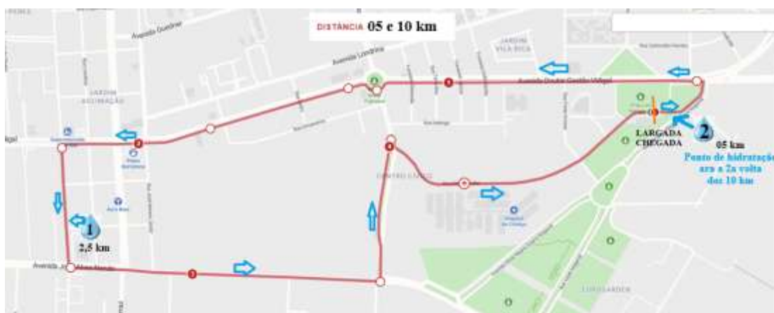
Figura 1 Percursos de 05 e 10 km

DESCRIÇÃO DA CORRIDA COM PERCURSO DE 05 KM: Largada na Rua Alcindo Keller (Praça do Antigo Aeroporto), vire à esquerda na Avenida Sônia Regina Guerra Nogaroli e vire à esquerda na pista contra-mão da Avenida Doutor Gastão Vidigal, contorne a rotatória no sentido horário da praça Jitsuji Fujiwara, continue na pista contra-mão da Avenida Doutor Gastão Vidigal, vire à esquerda na Rua Maringá, passando pelo Ponto de Hidratação 01(2,5km), vire à esquerda Avenida José Alves Nendo, vire à esquerda na Rua Cambira. Mantenha-se à esquerda para continuar na Rua Cambira, vire à direita na Rua Alcindo Keller.