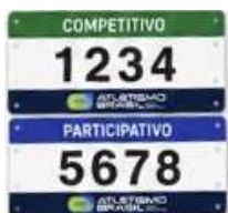
Figura 3 - Identificação Visual Obrigatória – Exemplo.

Em conformidade com a atualização da Norma 07 da CBA , todos os números de peito entregues aos atletas possuirão identificação visual obrigatória e distinta sobre a natureza da prova, como indica o exemplo da figura abaixo: