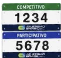
Figura 3 - Identificação Visual Obrigatória – Exemplo.

Em conformidade com a atualização da Norma 07 da CBAAt , todos os números de peito entregues aos atletas possuirão identificação visual obrigatória e distinta sobre a natureza da prova, como indica o exemplo da figura abaixo: